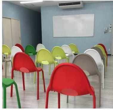
セミナールーム1室（26席）

無線LAN ホワイトボード ※利用については当金庫との共催もしくは後援が必要です。 ※内容について事前に打ち合わせさせていただきます。