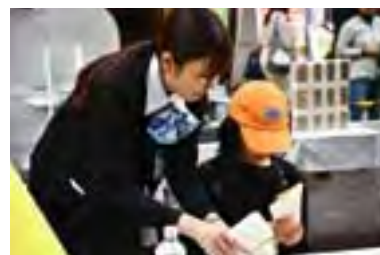
やるキッズ会場風景

イベントには、当金庫を含め22企業が参加し、628名の子供達に様々な職業を体験してもらいました。お仕事体験の後には、体験でもらった仮想通貨（GON）とお菓子を交換することで、社会のお金の流れを疑似体験していただきました。参加企業様、お客様にも大変好評なイベントであり、地域活性化の一つとして、今後も開催したいと考えております。