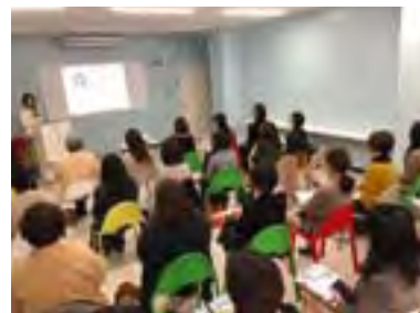
セミナー会場風景

外部関係機関と連携したセミナーも積極的に行っており、日本政策金融公庫と連携した創業者向けの「創業セミナー個別相談会」や、熊本市産業振興課と協力して大学の研究成果と事業者のニーズを結びつける「産学連携マッチングイベント ラウンドテーブル」、中小企業基盤整備機構と連携した「中小企業大学校サテライト・ゼミ」、熊本県よろず支援拠点と連携した「女性企業家応援セミナー」等の創業や売上拡大、クラウドファンディング活用法等のセミナーを開催しています。